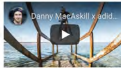
Danny MacAskill x addi...